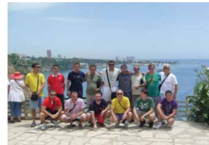
Спортски живот у Анталији

Наши играчи трудили су се да “спортски” живе током такмичења, тако да су пазили на исхрану, избегавали ноћне изласке и алкохол, као и излагање сунцу.