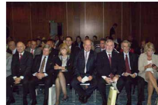
„Дан адвокатуре Словеније 2010“